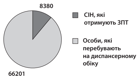
Охоплення споживачів ін'єкційних наркотиків ЗПТ