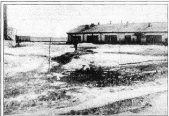
Лагерь Рязань-Дягилево. 1947 год