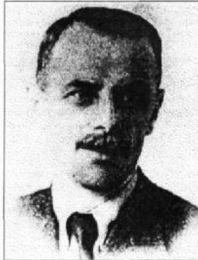
Генерал Казимеж ТУМИДАЙСКИЙ погиб в лагерном госпитале во время июльской голодовки 1947 года.