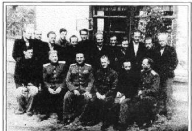
Лагерьная «идиллия»: чекисты с ударниками-«демократами»